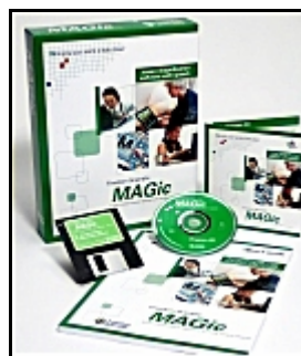
Contenuto della confezione