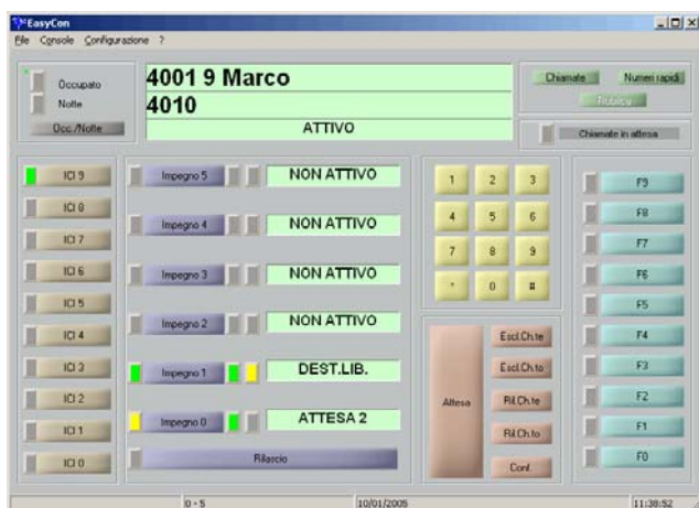
Maschera software EasyConsole

EasyConsole è rivolto anche agli operatori ipo-vedenti e non vedenti: il Terminale Braille , la Sintesi Vocale e l' ingranditore forniscono agli operatori le informazioni necessarie per gestire la chiamata.