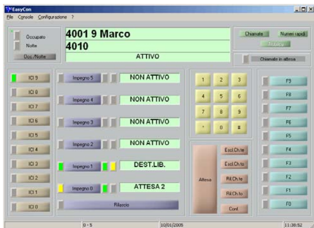
Maschera software EasyConsole

EasyConsole è rivolto anche agli operatori ipo-vedenti e non vedenti: il Terminale Braille , la Sintesi Vocale e l' ingranditore forniscono agli operatori le informazioni necessarie per gestire la chiamata.