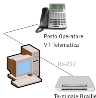
Schema di collegamento del Terminale Braille con Posto Operatore VT Telematica

La flessibilità di questi prodotti permette ad utenti non vedenti l'utilizzo del Personal Computer in tutte le funzionalità per l'ufficio.